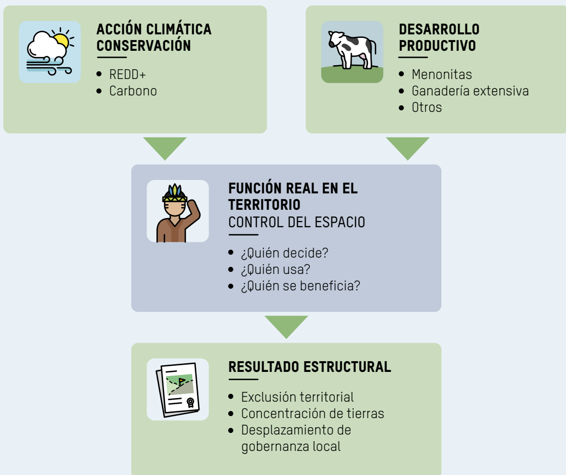
FIGURA 3: Funciones territoriales convergentes

instrumentos y narrativas mediante los cuales esta se ejerce. En la actualidad, estas dinámicas se presentan bajo lenguajes de conservación ambiental, acción climática o desarrollo productivo, que pueden operar de manera irregular y/o excluyente sobre los territorios amazónicos.