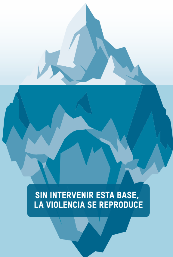
FIGURA 4. Iceberg del despojo territorial y la violencia contra personas defensoras en la Amazonía

Como se ilustra en la Figura 4, el enfoque del iceberg se utiliza como una herramienta analítica para comprender la violencia territorial en la Amazonía. Los ataques y asesinatos visibles representan solo la parte emergente de un entramado más amplio de violencias estructurales invisibilizadas —marcos normativos fragmentados, barreras administrativas, racismo estructural y ausencia de protección efectiva—. Sin intervenir estas capas subyacentes, las respuestas centradas exclusivamente en la violencia letal resultan insuficientes para prevenirla y fortalecer la gobernanza territorial.