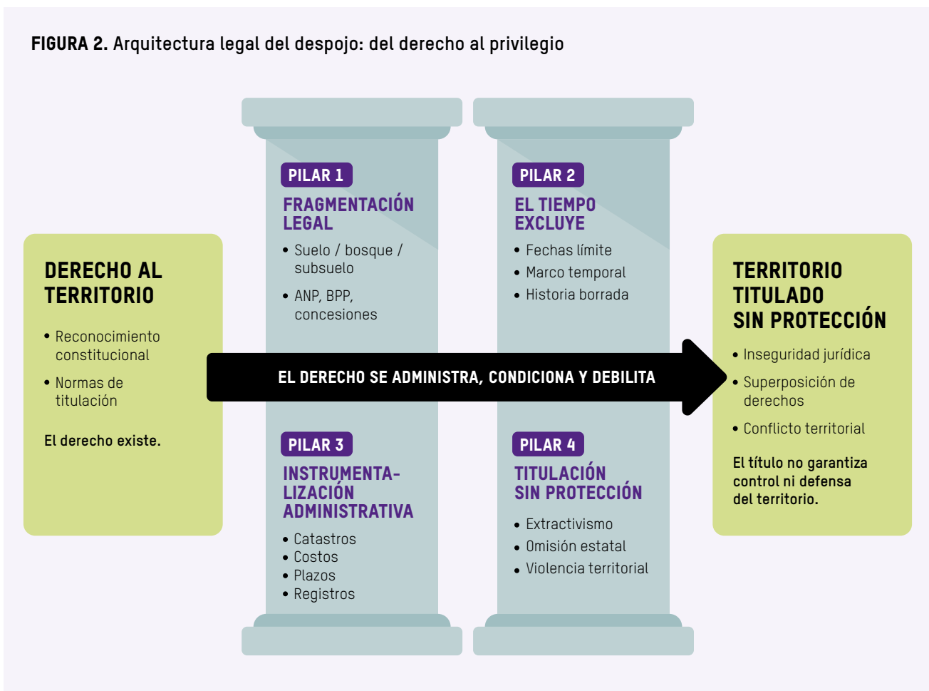
FIGURA 2. Arquitectura legal del despojo: del derecho al privilegio

Así, el derecho al territorio se convierte en un instrumento para el que basta con administrar el territorio y a sus habitantes como objetos de gesti3n y no como sujetos de derechos garantizados. Estos efectos se reflejan en cuatro pilares (Figura 2) que operan de forma interdependiente, configurando un entramado estructural que limita la protecci3n efectiva del territorio amaz3nico y profundiza desigualdades.