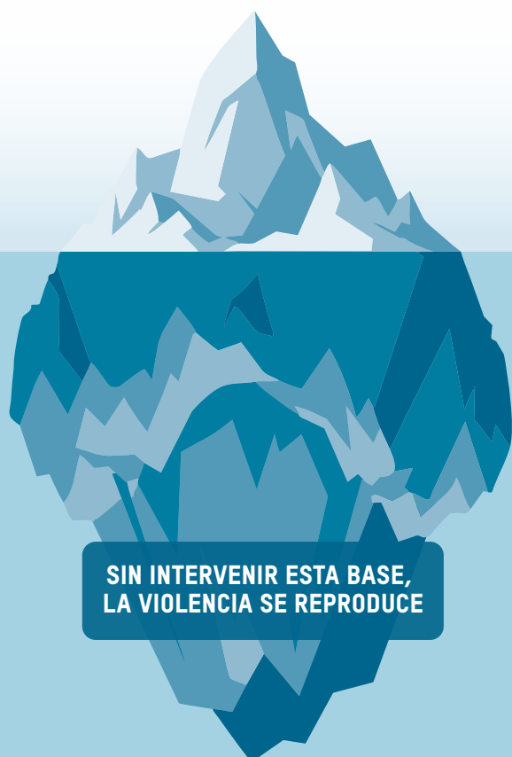
FIGURA 4. Iceberg del despojo territorial y la violencia contra personas defensoras en la Amazonía

Como se ilustra en la Figura 4, el enfoque del iceberg se utiliza como una herramienta analítica para comprender la violencia territorial en la Amazonía. Los ataques y asesinatos visibles representan solo la parte emergente de un entramado más amplio de violencias estructurales invisibilizadas —marcos normativos fragmentados, barreras administrativas, racismo estructural y ausencia de protección efectiva—. Sin intervenir estas capas subyacentes, las respuestas centradas exclusivamente en la violencia letal resultan insuficientes para prevenirla y fortalecer la gobernanza territorial.