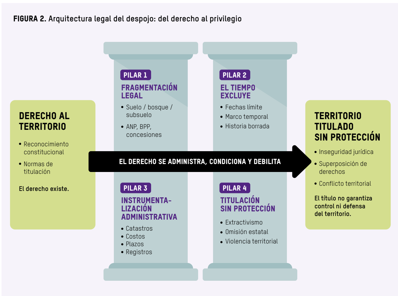
FIGURA 2. Arquitectura legal del despojo: del derecho al privilegio

Así, el derecho al territorio se convierte en un instrumento para el que basta con administrar el territorio y a sus habitantes como objetos de gesti3n y no como sujetos de derechos garantizados. Estos efectos se reflejan en cuatro pilares (Figura 2) que operan de forma interdependiente, configurando un entramado estructural que limita la protecci3n efectiva del territorio amaz3nico y profundiza desigualdades.