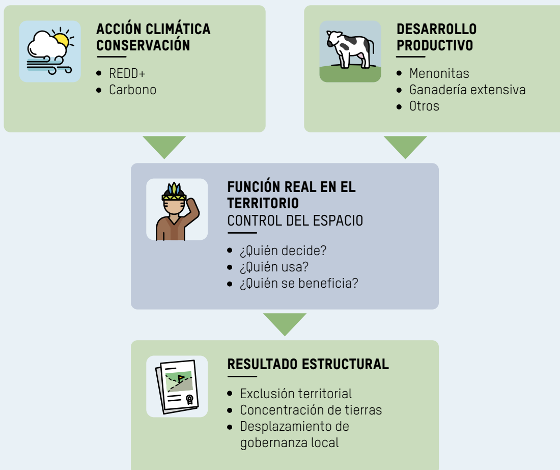
FIGURA 3. Funciones territoriales convergentes

instrumentos y narrativas mediante los cuales esta se ejerce. En la actualidad, estas dinámicas se presentan bajo lenguajes de conservación ambiental, acción climática o desarrollo productivo, que pueden operar de manera irregular y/o excluyente sobre los territorios amazónicos.